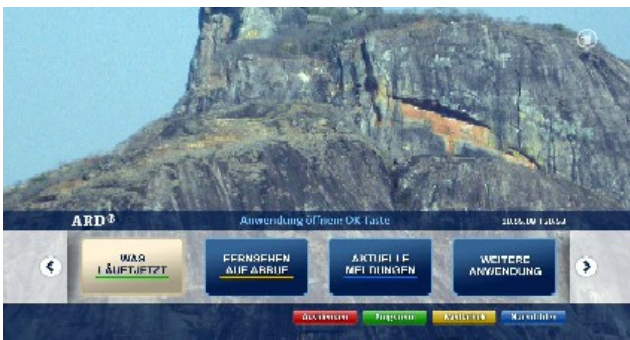
Sl. 1. ARD početna aplikacija

Definirane su dvije osnovne vrste aplikacija. Prvu grupu čine aplikacije logički vezane za uslugu koja se trenutno emituje (TV kanal). Standardni primjeri ovakvih aplikacija su digitalni teletext, elektronski programski vodič, mogućnost ponovnog gledanja emitovanih emisija i dr. Na slici 1. prikazana je početna aplikacija njemačkog TV emitera ARD. Svrha početne aplikacije je pokretanje ostalih aplikacija ponuđenih od strane emitera. Drugu grupu čine aplikacije nezavisne od trenutno emitovane usluge. Ovim aplikacijama se pristupa preko internet portala, ukoliko je takav dostupan.